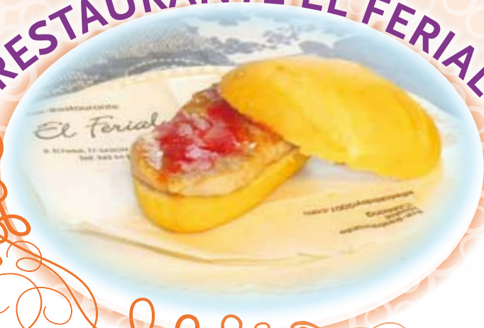
Lámina de solomillo de cerdo con salsa de pimientos Mini-hamburguesa de 'El Ferial' con pan de pipas Burrito desmigado de morcilla, con cebolla y pimientos